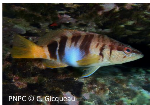
Sciarrano Serranus scriba