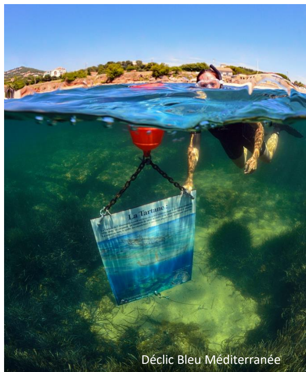
Percorso sottomarino di Olbia Cartello della tartana

Il percorso sottomarino di Olbia si trova sulle vestigia di una banchina romana, nelle vicinanze di un relitto di tartana carico di blocchi di roccia che offrono rifugio a numerose specie acquatiche.