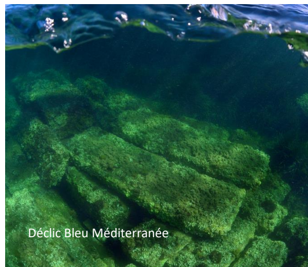
Vestigia della tartana