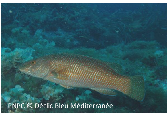
Tordo marvizzo Labrus viridis