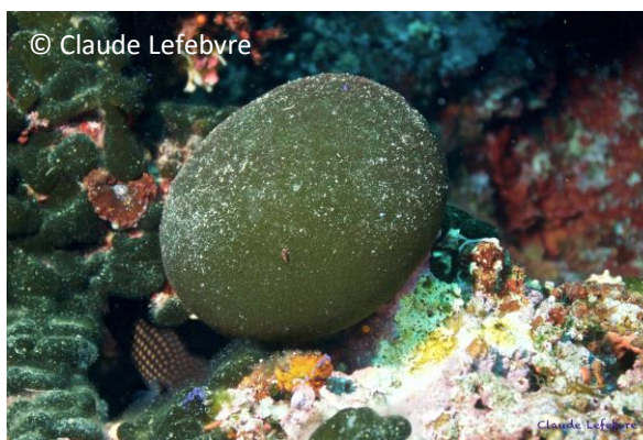
Palla verde Codium bursa