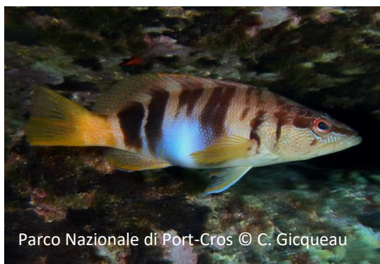
Sciarrano Serranus scriba