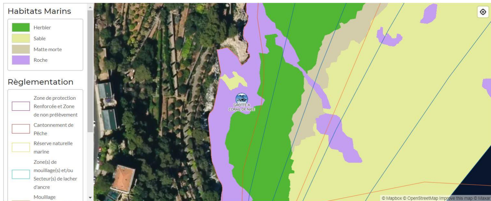
Carte des habitats (SIG)

Ce site se pratique en randonnée palmée mais il faut plonger pour voir la grotte. De nombreuses espèces sont fixées au plafond de la grotte comme le corail rouge, la dentelle de Neptune ou encore l'éponge encroûtante orange. Le sol est parsemé de cérianthes. Attention de ne pas heurter le plafond afin de ne pas abimer le corail.