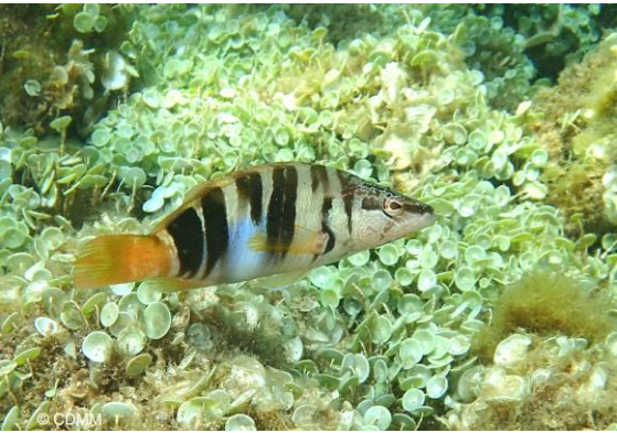
Serran écriture sur acétabulaire

Photos du patrimoine environnemental et liste de quelques espèces