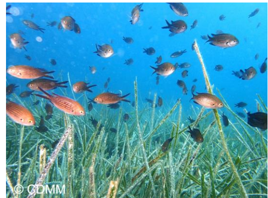
Castagnoles sur la posidonie