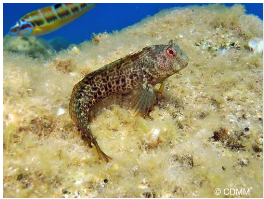
Blennie pilicorne ( Parablennius pilicornis )

Photos du patrimoine environnemental et liste des espèces principales