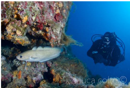
luca coltri ©