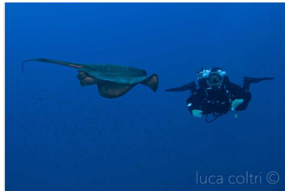
luca coltri ©